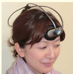
a 超小型近赤外分光装置

私たちはさまざまな装置を使って、人間が身体を動かしたり、何かを考えたりしている時の脳の働きを画像化するさまざまな技術を持っています。こうした技術の一つに、近赤外光という光線を使って大脳の働きを知ることがあります。近赤外光は人間の皮膚や筋肉、