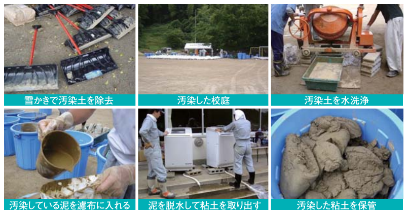
図2/宮城県丸森町耕野小学校の校庭の除染

人体に影響のないレベルとなっています(東北大学のホームページ、東日本大震災に関する情報、福島第一原子力発電所事故に係わる放射線モニタリング情報を参照)。 また、食物に関する汚染は、水道水については一ベクレル/kg以下、原乳、路地野菜も数ベクレル/kg以下と非常に低く(宮城県のホームページ、放射能情報サイトみやぎを参照)、食物に含まれる自然の放射能(例えば、ほうれん草では七〇〜三七〇ベクレル/kgのカリウム40を含んでいます。)を大幅に下回っています。