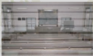
東北大学工学部建築工学科の建築模型