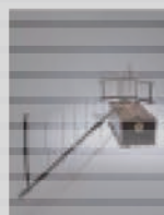
東北大学工学部建築工学科の建築模型